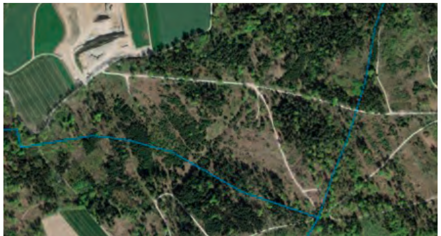
Buerwald im Frühling 2019

Die Gemeinde Lostorf umfasst eine Fläche von 1327 Hektaren wovon 650 Hektaren bestockt, also mit Wald bedeckt, sind. Dies entspricht einem Anteil von knapp 49%. Der grösste Teil dieses Waldes gehört der Bürgergemeinde, nämlich rund 433 Hektaren. Weitere 65 Hektaren gehören dem Kanton und 149 Hektaren sind in Privatbesitz.